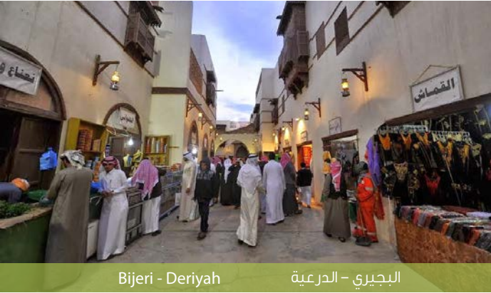
Bijeri - Deriyah

يصاحب المنتدى معرض متخصص حول الأفكار والابتكارات الحديثة للتخطيط الحضري وإدارة المدن وخدماتها. حيث تسعى وزارة الشؤون البلدية والقروية إلى تحقيق زيادة في تنافسية المدن وتحقيق مدن مستدامة برفع كفاءة الخدمات وتحسين سبل وطرق التخطيط العمراني وتنمية الكوادر المؤهلة لتبنى الأفكار والحلول المبتكرة والحديثة للتخطيط وإدارة توفير الخدمات البلدية وتنمية الأراضي، حيث يعتبر المعرض المصاحب المكان المناسب لعقد شراكات فاعلة بين شركات إقليمية ومحلية ودولية والمختصين من وزارة الشؤون البلدية والقروية والأمانات والبلديات والجهات الحكومية من مقدمي الخدمات على المستوى البلدي وكذلك من المؤسسات الإقليمية والدولية العاملة في هذا المجال، وذلك من خلال الأقسام التالية: